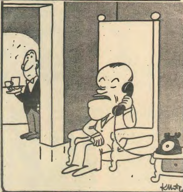
— Παράγγελα κοφιδάκι. Έγκρίνεται; (του Κώστα Μητρόπουλου)

Στην Χιλή υπάρχει το φασιστικόν κίνημα «Πατρίς και